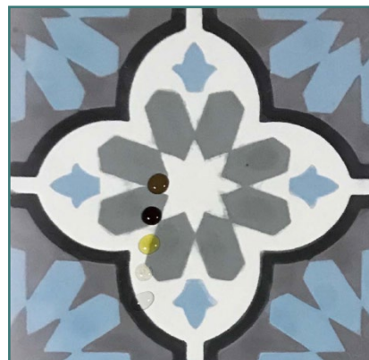
3/ На водна основа, без да променя цвета на плочката.