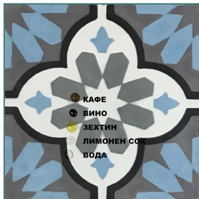
2/ Не на водна основа с засилване на цвета.